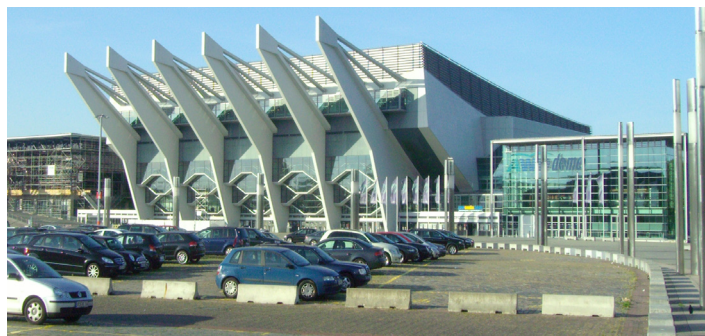
Die „Bremen Arena“,

Zu den zentralen Feierlichkeiten werden rund 1500 geladene Gäste kommen. Unter anderem zählen zu den Gäs-