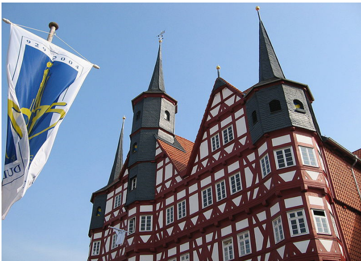
Das Rathaushaus der Stadt Duderstadt