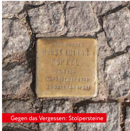
Gegen das Vergessen: Stolpersteine

Dieser starken Aufforderung werden wir uns heute, am 9. November, in unserem Konzert mit Texten und Musik zu nähern versuchen. In der deutschen Geschichte gibt es wohl kaum ein anderes Datum, das so eindrücklich die ambivalenten gesellschaftlichen Folgen menschlichen Verhaltens sichtbar macht wie der 9. November. Die jeweiligen an die-