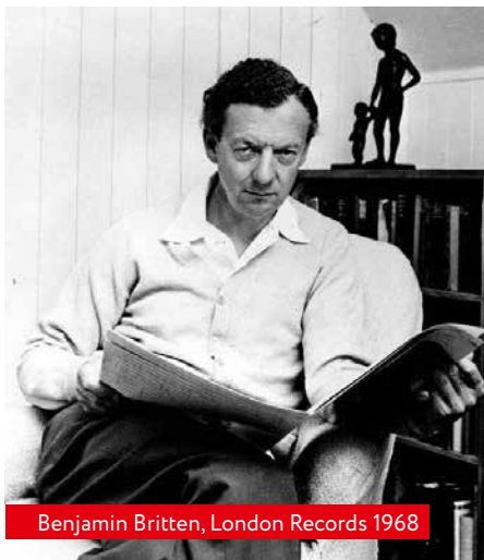
Benjamin Britten, London Records 1968

Hier scheint mir der Trost mehr den auf Erden Verbleibenden zgedacht: Seht, wie scheußlich das Leben auf der Erde sein kann. Selbst wenn man alles gibt, wird man immer wieder in schwierige Lagen gebracht, und es ist vor allem Mühe und Arbeit. Die ist jetzt für die Toten vorbei. Dann noch der Bonus für die Gläubigen: Jetzt können sie die Ernte ihrer Arbeit einfahren, und das auch noch zeitlich unbegrenzt, in Ewigkeit. Gleichzeitig aber auch der Hinweis, sich nicht zu sehr in Verdruss zu suhlen: