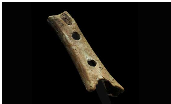
Foto: Divje-Babe-Knochenflöte aus dem Jahr 43.100 ± 700 v. Chr., Nationalmuseum Slowenien. Ein mit Löchern versehener Höhlenbären-Oberschenkelknochen, 1995 im archäologischen Park Divje Babe im Nordwesten Sloweniens gefunden.