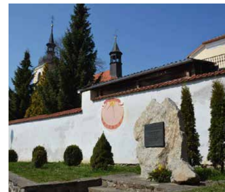
Zelenka-Denkmal in Louňovice pod Blaníkem, Tschechien

Zelenka entschied sich in dieser späten Schaffensphase bewusst für diese Besetzung, nicht zuletzt, weil besonders die Blasinstrumente der Zeit in ihren Möglichkeiten noch sehr begrenzt waren und damit Zelenkas Drang nach freier, virtuoser Entfaltung im Wege standen.