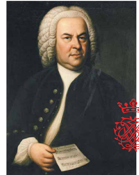
Johann Sebastian Bach im Alter von 61 Jahren, von Elias Gottlob Haussmann, Kopie oder Zweitversion seines Gemäldes von 1746.

Der letzte Satz bringt wieder viel Bewegung und Energie. Oboe und Violine treiben sich gegenseitig an, spielen schnelle Figuren und wechseln sich mit reizvollen Motiven ab. Die Musik wirkt lebendig, rhythmisch und voller Vorwärtsdrang. Genau passend zu Silvester, möge das neue Jahr auch diesen Schwung haben.