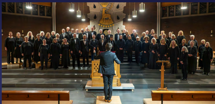
Der Bremer RathsChor am 09.11.2025 in der St. Ursula-Kirche

In seiner Missa Votiva von 1739 rasen die Streicher rauf und runter wie auf verwinkelten Piranesitreppen, nur ohne deren Düsternis, sie treiben im Gloria den Chor vor sich her mit einer druckvollen Dramatik, die an Mozarts Figaro denken lässt.“