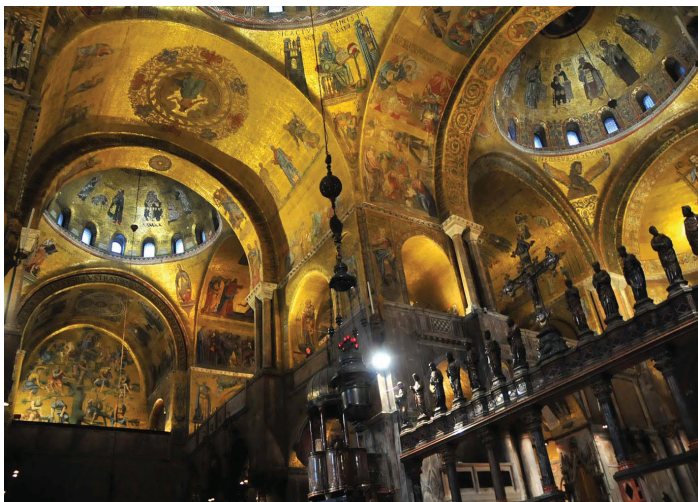
Der Markusdom (Basilica di San Marco)

Claudio Monteverdis Werke sind zwar für große Kirchen geschrieben, sie wirken aber auch in kleinen sehr schön und beschreiben einen großen Umbruch in der Musik des siebzehnten Jahrhunderts. Dieses Magnificat ist wie die das klangvolle, bis zu 7-stimmige bekannte Magnificat Bestandteil der Motettensammlung der Marienvesper. Es ist einfach als bescheidene (weil: weniger Sänger, weniger Instrumente, kürzer) Variante gedacht. Auch dieses Magnificat ist prachtvoll aufgebaut und wirkt durch seine Sechsstimmigkeit und die Wechsel zwischen Solo- und Chorgesang sehr beeindruckend.