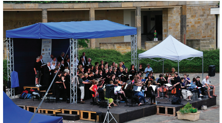
RathsChor und Prager Studentenorchester bei der Anspielprobe in der Gedenkstätte Lidice. Wenig später gabs Regen, der zum Glück vor dem Konzert aufhörte

Mit dem Mozart-Requiem im Gepäck hatte der Bremer RathsChor vom 5. bis 9. Juni eine Konzertreise in die Tschechische Republik unternommen. Die perfekt organisierte Reise stieß allerdings auf das musikalische Problem, dass das offensichtlich mitgliederstarke Prager Studentenorchester möglichst vielen unterschiedlichen Musikerinnen und Musikern Gelegenheit bieten wollte, mit Wolfgang Helbich zu arbeiten. So wechselte die Besetzung des Orchesters von Probe zu Probe und von Konzert zu Konzert, was zumindest etwas irritierend und für den Dirigenten, vorsichtig ausgedrückt, beunruhigend war. Ansonsten war die Aufnahme des RathsChors in Prag und Lidice außerordentlich herzlich und der Zuspruch zu den beiden Konzerten lebhaft. Der Hintergrund für diese Tournee, die zweitweise durch sehr heftige Regenfälle begleitet wurde, ist im letzten Newsletter (Nr. 15) ausführlich beschrieben.