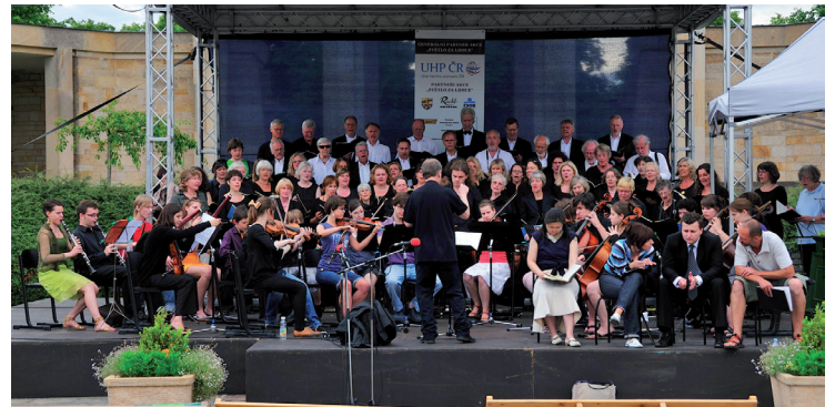
Anspielprobe auf der open-air-Bühne der Gedenkstätte Lidice

Immer wieder ist Bachs Johannes-Passion , zumal in der Interpretation von Wolfgang Helbich, ergreifend. Die dabei herausgearbeiteten Feinheiten, die Stimmungs- und Belichtungsunterschiede in den Chorälen, die lebhaften Turbae-Chöre, die reflektierenden Arien und die von den Ereignissen berichtenden Rezitative wurden vom Chefdirigenten des RathsChors so eng und unmittelbar miteinander verknüpft, dass die Zuhörerinnen und Zuhörer am 13. April in St. Marien, Delmenhorst, und 14. April in der Glocke eine packende, faszinierende Passionsgeschichte erlebten.