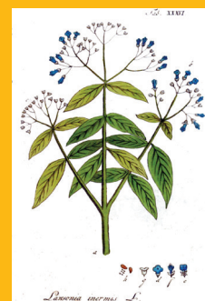
Cypern = Hennastrauch