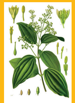
Cynamen / Zimt