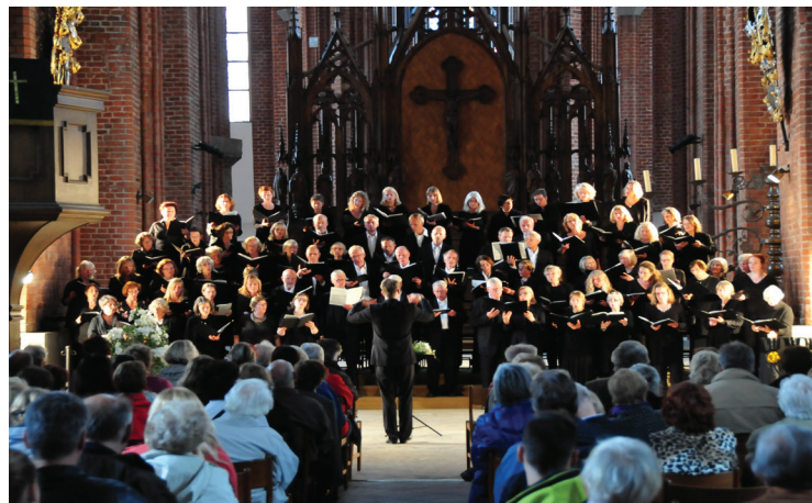
Konzert des Bremer RathsChors in der St.Petri-Kirche zu Riga

Noch ganz erfüllt sind viele Chormitglieder von ihren Eindrücken, die sie bei der Konzertreise in die lettische Hauptstadt Riga gewinnen konnten. Von den incl. Hin- und Rückreise fünf Tagen war der Bremer RathsChor an drei Tagen bei eigenen Konzerten aktiv. Das erste fand in der St. Petri-Kirche in Rigas altem Zentrum statt, in der das „Licht“-Programm gesungen wurde, das der Chor zuvor in Syke aufgeführt hatte.