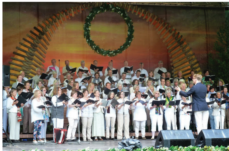
Auftritt des Bremer RathsChors auf der Freiluftbühne im Mežaparks

Am 21. und 22. Juni war für den Chor eine Freiluftbühne im Mežaparks reserviert: Anlässlich der tagelangen Feiern zum Mittsommerfest war hier eine der Attraktionen das „Rīga 2014 Pasaules saulgriežu festivāls“, Auführungen verschiedener Gruppen aus Europa und darüber hinaus. So kamen hier zusammen mehrere Folklore Ensembles aus Estland, Lettland, und Rumänien, eine traditionelle Musikgruppe aus Mazedonien, eine Jazz-Gruppe aus Georgien eine spanische Latino-Musikgruppe aus Kolumbien, eine indische Tanzgruppe und der Bremer RathsChor.