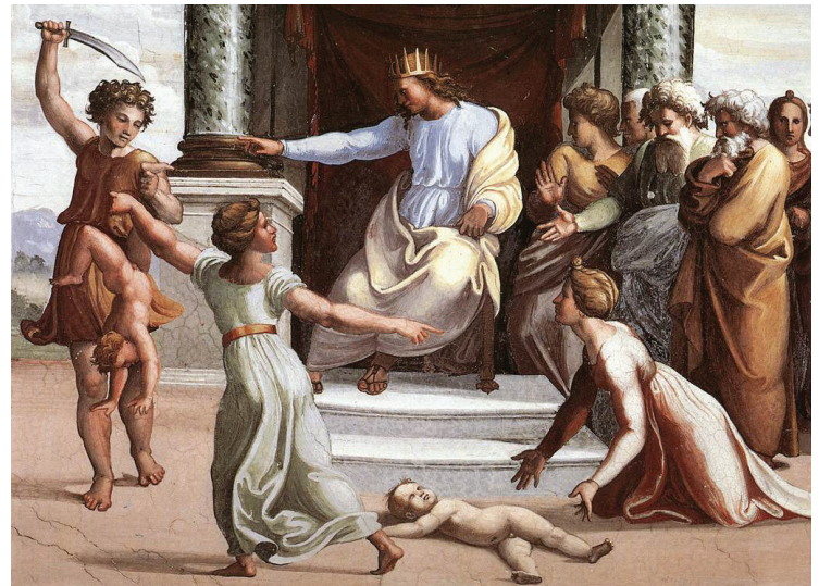
Das Urteil des Salomo, Raffaello Sanzio da Urbino, 1519

durch den Priester Zadok und den Propheten Nathan berichtet - und vom Jubel des Volkes. Somit wird während der Krönungsfeierlichkeiten ein religiös-politischer Bezug zwischen dem sagenumwobenen König Salomo und der aktuellen Krönung hergestellt.