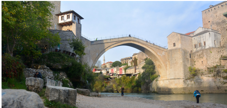
Die berühmte wieder aufgebaute alte Brücke von Mostar