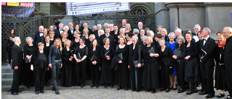
Der Bremer RathsChor vor der Philharmonie in Odessa