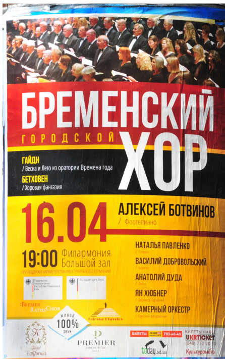
Plakat an einer der zahlreichen Litfass-Säulen in Odessa mit der Ankündigung unseres Konzertes dort am 16. April 2016

Projekt einer musikalischen Partnerschaft Bremen-Odessa