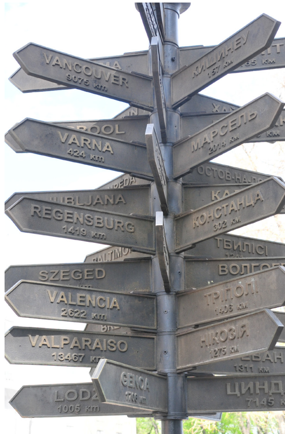
Wohin? Ein Wegweiser zu den Bruder- und Partnerstädten in Odessa in der Nähe des Rathauses, gesehen bei der Stadtführung